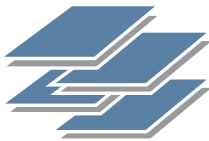
Clasificación en Offset